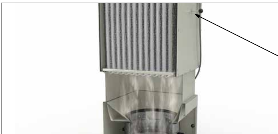
DS 6 účinné ruční čištění