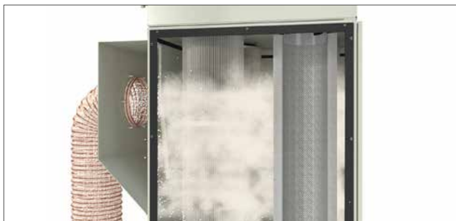
DS 6 s pneumatickým čištěním s řízením podle tlakového rozdílu