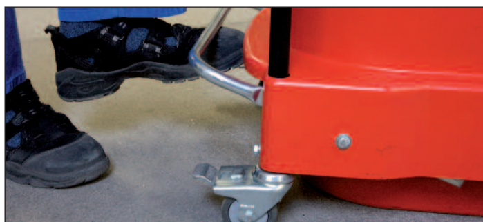
Nejsnadnější „manipulace“ vyprazdňováním nožní pákou