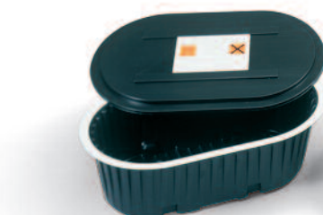
Likvidační vana s víkem