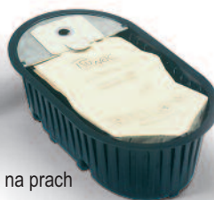
Filtrační sáček na prach