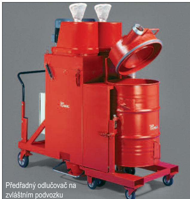
Předradný odlučovač na zvláštním podvozku